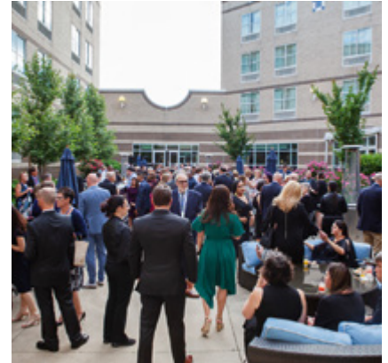
Mitarbeiter und Kunden feierten im Juni den 100. Geburtstag von Rieck-Partner CH Powell in Boston.

CH Powell beschäftigt in den USA über 200 Mitarbeiter an 18 Standorten – ein stabiles Geschäftsnetz von dem auch Rieck-Kunden profitieren. Regelmäßig transportiert RSACI Import- und Exportsendungen zwischen Europa und den